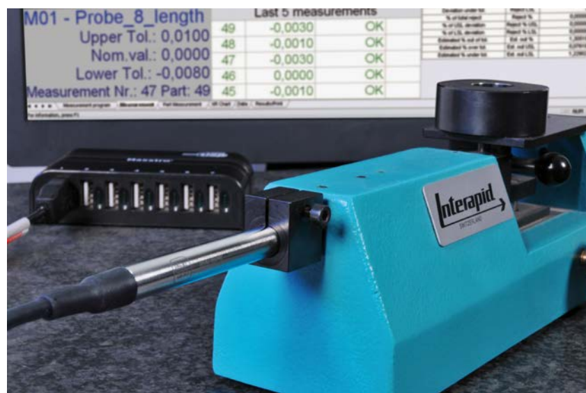
Utilisation d'un palpeur USB avec un banc de mesure INTERAPID SHE

Les touches de mesure quant à elles peuvent être échangés ou remplacés. Ainsi, chaque utilisateur peut choisir la touche appropriée parmi un large éventail de géométries, formes et tailles différentes. Par ailleurs, tous les palpeurs USB sont fournis avec un rapport de mesure.