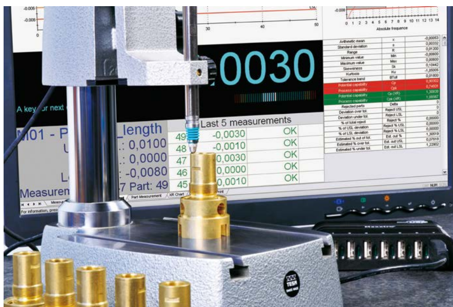
Mesure d'un lot de pièces avec affichage des mesures sur le logiciel STAT-EXPRESS

Il existe également la possibilité d'utiliser les logiciels TESA DATA-DIRECT ou TESA STAT-EXPRESS avec les palpeurs USB : ces logiciels disponibles en option offrent des fonctionnalités avancées telles que l'exportation des données en fichier CSV ou la création de rapports de mesure détaillés et de statistiques.