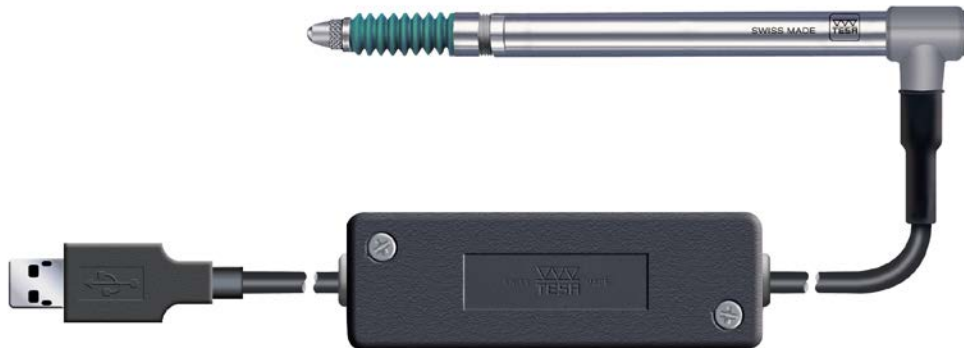
Palpeur GT 62 USB avec étendue de mesure \pm 5 mm

durabilité qui font la renommée des palpeurs inductifs TESA depuis plus de 40 ans. En effet, ces instruments utilisés lors de la mesure comparative atteignent une précision en dessous du micron en mode de mesure aussi bien statique que dynamique.