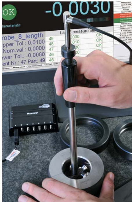
Mesure comparative intérieure avec un palpeur USB, un VERIBOR et une bague étalon

Le logiciel TSIP permettant l'affichage des valeurs d'un à quatre palpeurs ainsi que l'indication des tolérances est inclus dans la livraison. Il offre de nombreuses fonctions telles que la mise à zéro sur une pièce étalon, la combinaison de deux palpeurs USB +A+B ou +A-B et l'acquisition des données de manière automatique ou manuelle. De plus, tous les résultats de mesure peuvent être sauvegardés en format XML.